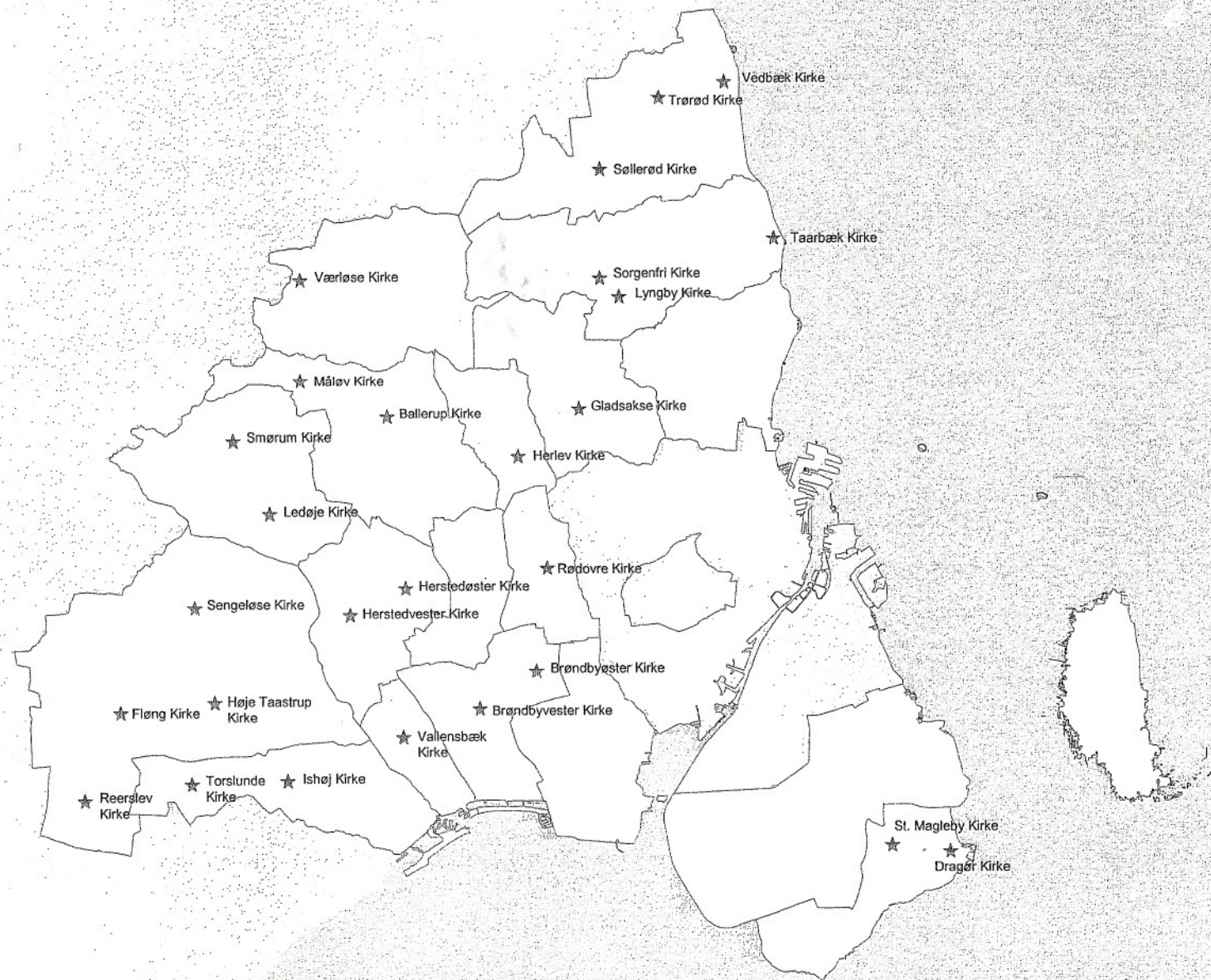
Kirker med beskyttelseslinje, Københavns amt